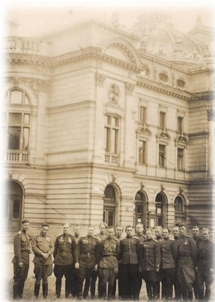
Освобождение г. Кракова 1945 г